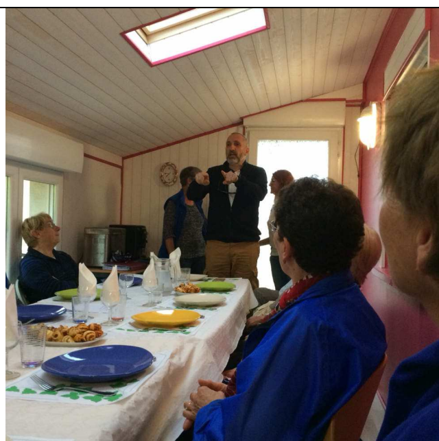
Visite du maire de Cornas