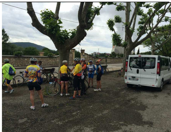
Pique-nique à Cruas