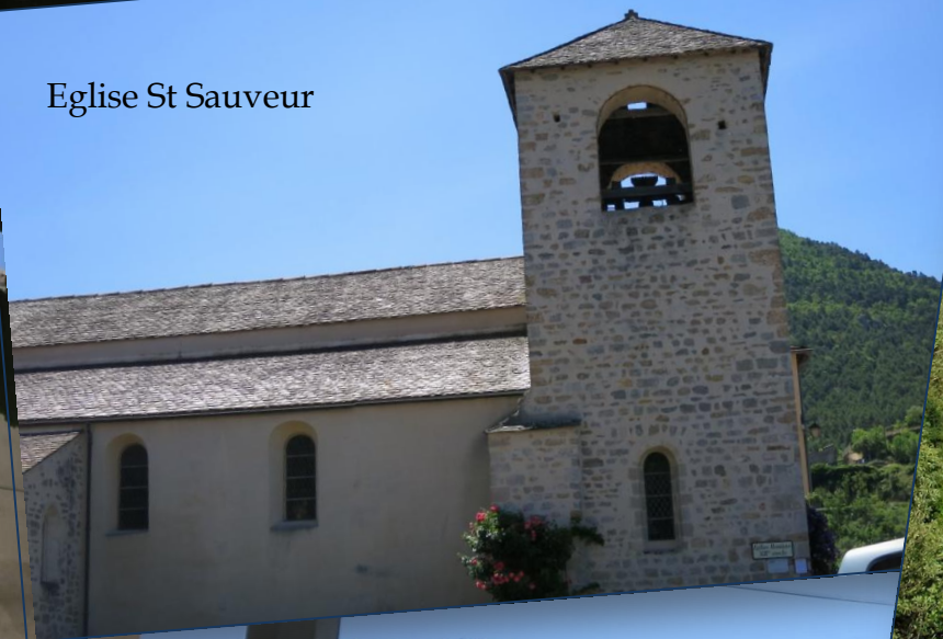
Eglise St Sauveur

Joli village situé au confluent du Tarn et de la Jonte, dans les gorges du Tarn et au début des gorges de la Jonte.