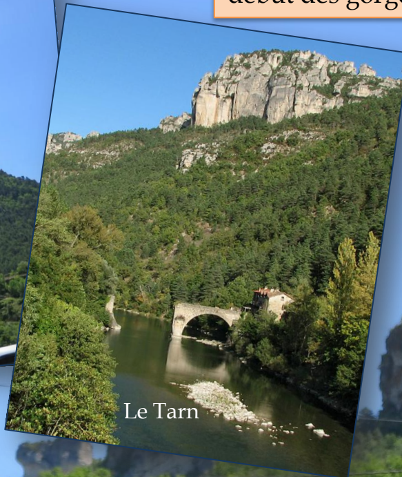
Le rocher de Capluc