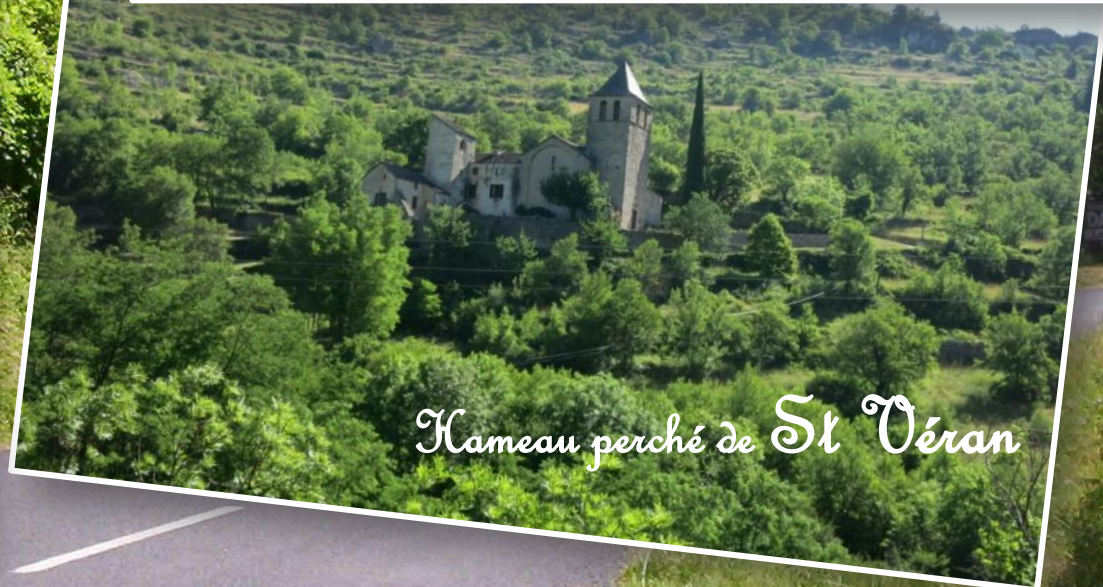
Hameau perché de St Vèran