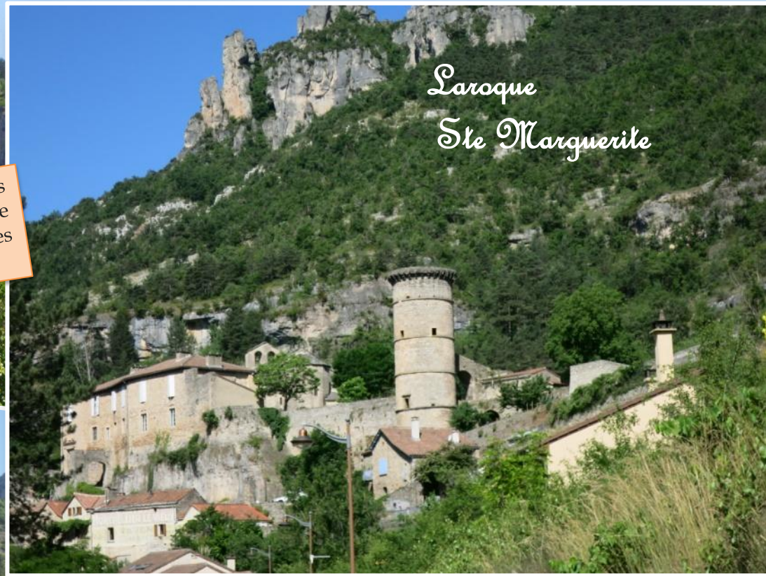
Laroque Ste Marguerite