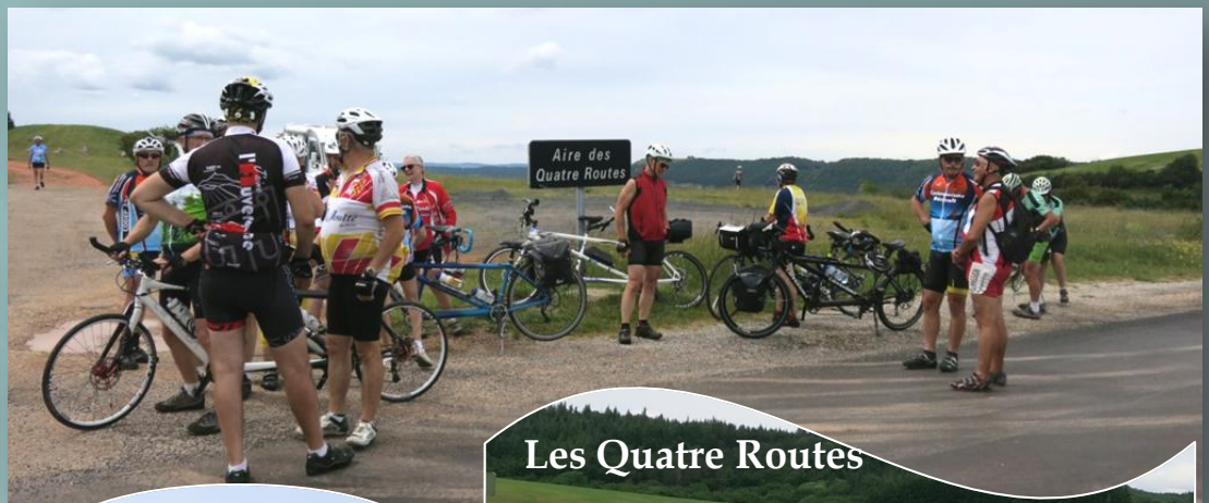
Les Quatre Routes