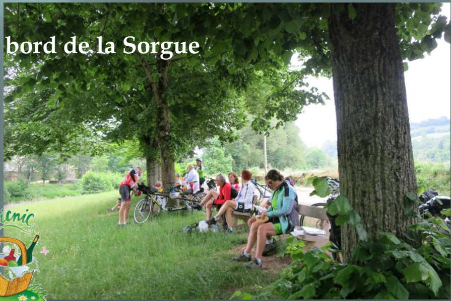
Pique nique au bord de la Sorgue