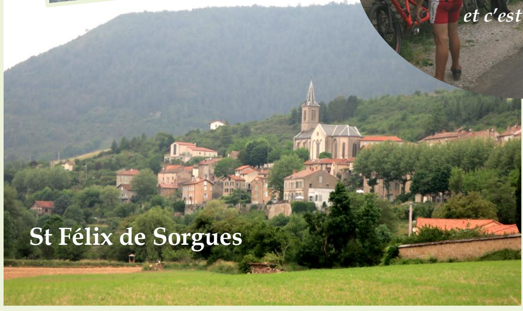
St Félix de Sorgues