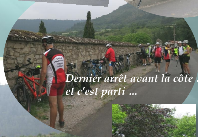
Dernier arrêt avant la côte ... et c'est parti ...