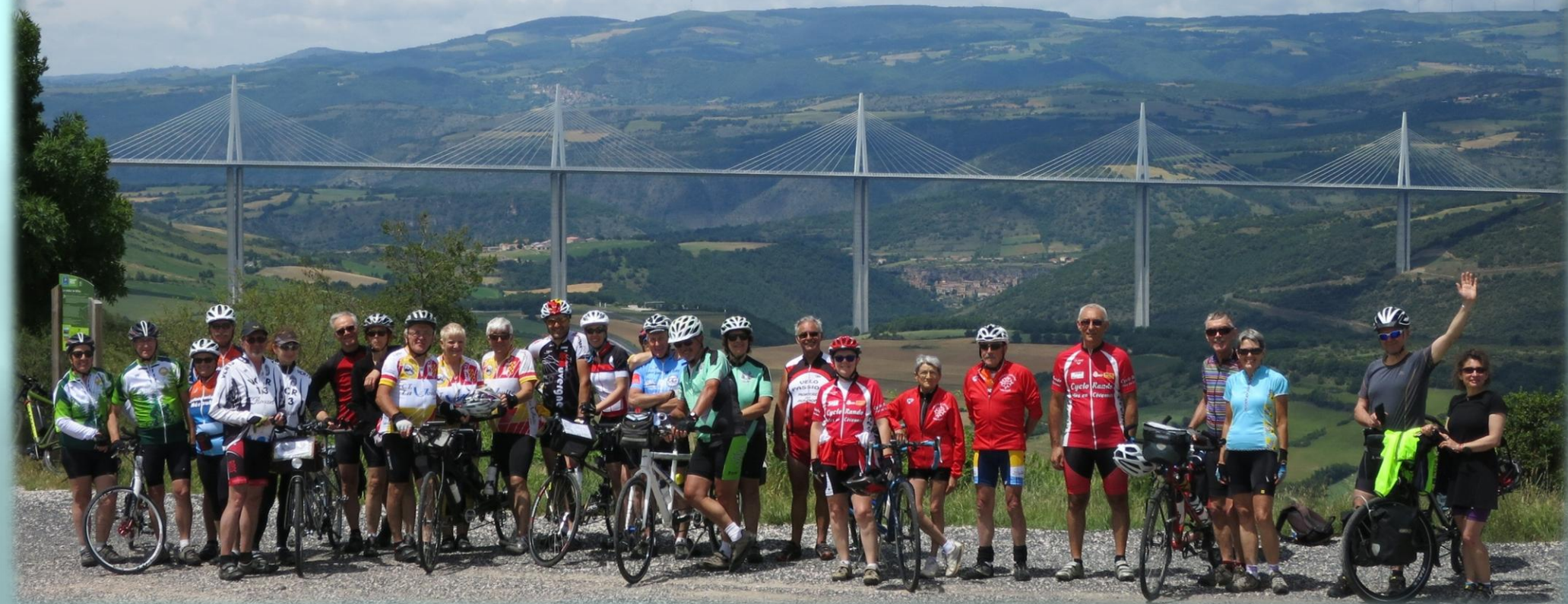
Viaduc de Millau - Pentecôte 2017 - Groupe TANDEM