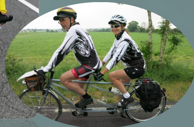
Dans la Vallée de la Sorgue