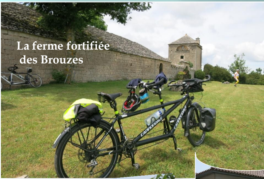
La ferme fortifiée des Brouzes