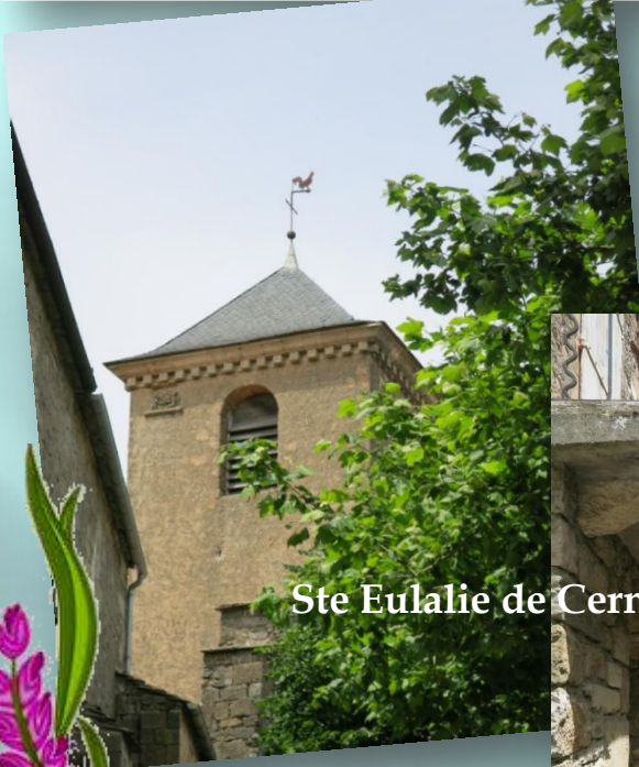
Ste Eulalie de Cernon